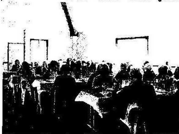
Parole de St Jerrain