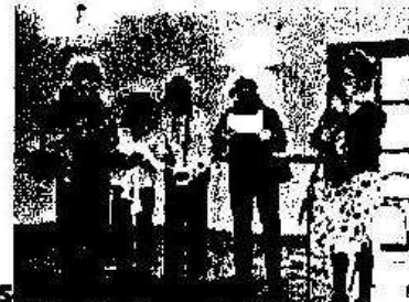
Repas des Anciens

28 janvier 2007 : un dimanche inoubliable pour celles et ceux qui ont pu venir nombreux au repas des Anciens, organisé par la municipalité de Saint-Jean de la Porte. Au menu : « douce vie » et ses feuilletés, terrine du chef, civet de sanglier, gratin dauphinois, flan de courgettes, fromages, charlotte aux poires et café, le tout arrosé « avec modération » des traditionnels vins savoyards. De l'avis de la majorité un repas de qualité.